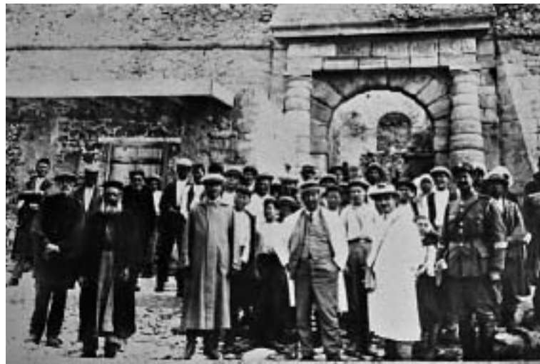
Ιατρός, ιερέας και τρόφιμοι, Σπιναλόγκα 1931.

Με την έλευση των Γερμανών οι συνθήκες δυσκόλεψαν ακόμα περισσότερο. Το φρουραρχείο Κρήτης κοινοποίησε διαταγή ότι δραπέτης Χανσεβικός θα εκτελούνταν με τουφεκισμό (Ρεμουντάκης, 1973: 157 & Zorbas, 1999: 45). Οι ασθενείς μάλλον αφέθηκαν στην τύχη τους και κάποιοι από αυτούς μάλιστα εκτελέστηκαν όταν βγήκαν να ζητιανέψουν. Κατά την περίοδο της Γερμανικής Κατοχής, ο υποσιτισμός των ασθενών ήταν διαρκής και κάποιοι από τους λεηρούς δεν άντεξαν και υπέκυψαν. Το 1942 οι ασθενείς αποφάσισαν να βγάλουν όλα τα υγιή παιδιά στη στεριά και να βάλουν φωτιά στο νησί, διαμαρτυρόμενοι για άλλη μια φορά για τις άσχημες συνθήκες διαβίωσης. Για να μην πραγματοποιήσουν την απειλή τους, οι δυνάμεις κατοχής τους μοίρασαν πάλι τρόφιμα. Οι ασθενείς προσπάθησαν εκ νέου να διαπραγματευθούν με τις δυνάμεις κατοχής την ένταξή τους στη δύναμη των στρατευμάτων κατοχής για λόγους επιβίωσης. Αυτό τελικά το κατόρθωσαν μετά τον Μάρτιο του 1943 και έτσι τουλάχιστον κάποιοι από αυτούς κατάφεραν να επιβιώσουν (Ρεμουντάκης, 1973: 157, Zorbas, 1999: 45 & Grivel 2002: 74-76).