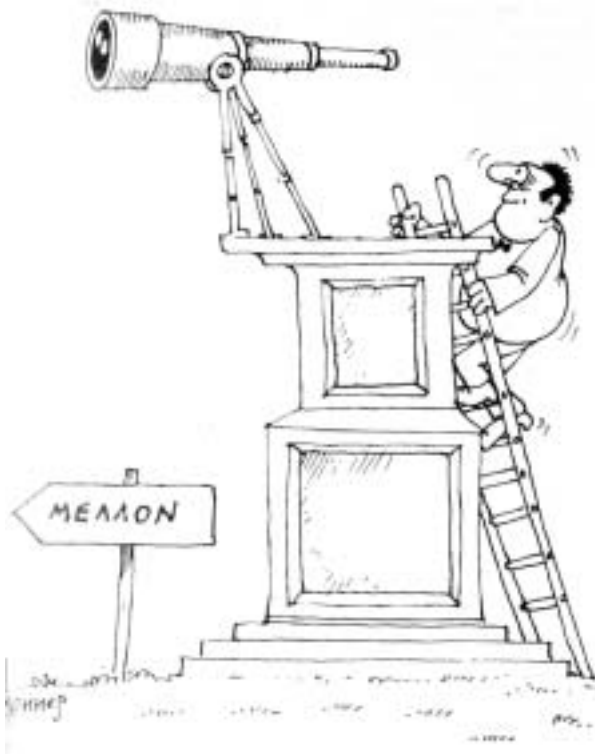
Από το περιοδικό «Η Διαφορά είναι Δικαίωμα», 1985. Γερμανός Δημιουργός.

φεται από την ίδια την εμπειρία του πληθυσμού, υπερβαίνοντας το πλαίσιο της υπηρεσίας υγείας και αλληλεπιδρώντας μαζί του, προκειμένου να σχεδιαστεί και να πετύχει όλο και μεγαλύτερους στόχους.